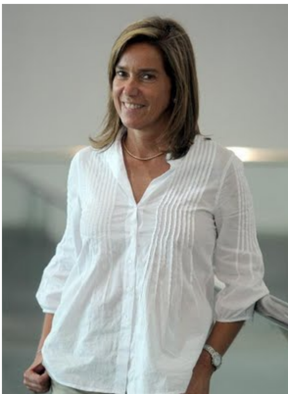
Ana Mato Adrover

del PP a las elecciones europeas, las gallegas y las vascas en 2009; de las elecciones municipales y autonómicas de 2011, y de las últimas elecciones generales.