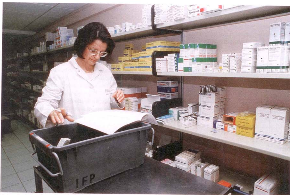
El fondo de la disputa es la hecha por el control minorista.

concentra cerca del 70% del empleo y el 65% del PIB. Con el paquete de medidas legislativas remitido a las Cortes bajo esa "ley paraguas" o "ley omnibus", cuyo proyecto acaba de aprobar el Consejo de Ministros, se pretende liberalizar, además del mercado de servicios, los transportes, las telecomunicaciones, la construcción, la sanidad y otros muchos ámbitos de la actividad económica, en un empeño por eliminar trámites y obstáculos administrativos que va a suponer una reforma de cerca de cincuenta leyes y más de un centenar de decretos. Como resultado de todo ello, el Ministerio de Economía confía incrementar la productividad con una subida del 1'2% del PIB y crear entre 150.000 y 200.000 empleos 4 . El recorte de trámites administrativos se quiere además unificar territorialmente. Ya no será necesario un permiso distinto en cada comunidad autónoma, como ocurrió, por ejemplo, en materia de caza y costó la dimisión de un ministro de justicia. Dentro del objetivo general de simplificación de procedimientos también se va imponer el juego del silencio administrativo en sentido positivo como nueva regla a favor del administrado (algo a tener en cuenta en el recurso gubernativo contra la calificación registral).