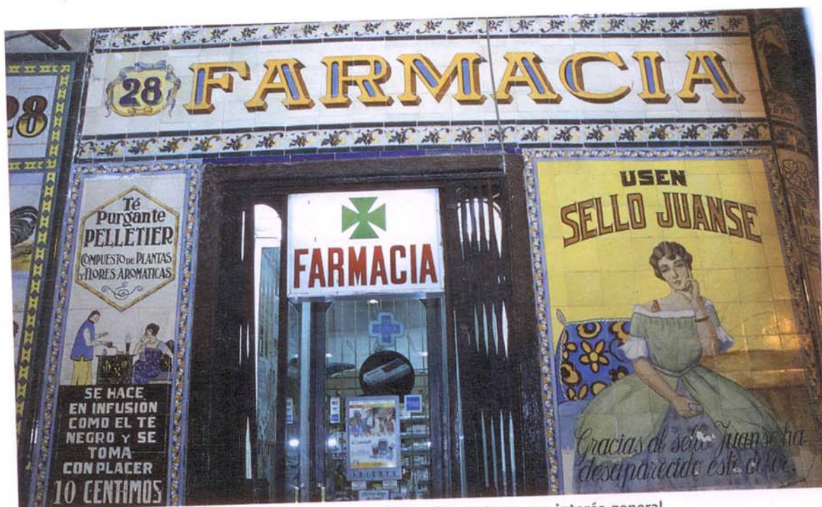
La Sala sentenciadora confirma que las restricciones legales protegen un interés general.

dad del mercado tiene sus riesgos. Nuestro legislador habrá de medir bien ese paso, valorando las particularidades de cada tipo de actividad económica y servicio profesional en atención al interés público y su función social. Si se precipita, puede tomar una dirección equivocada. La consecución de una sociedad civil invertebrada, inerte frente a un capitalismo de pillaje, obligaría muy pronto a revisar el paradigma de la competitividad como único motor de la economía.